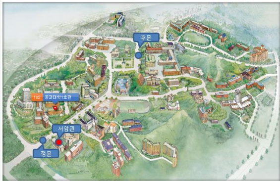
강원대학교 Campus Map (춘천캠퍼스)