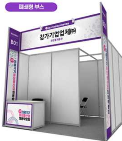
심화면접이 가능한 폐쇄형 부스 제공